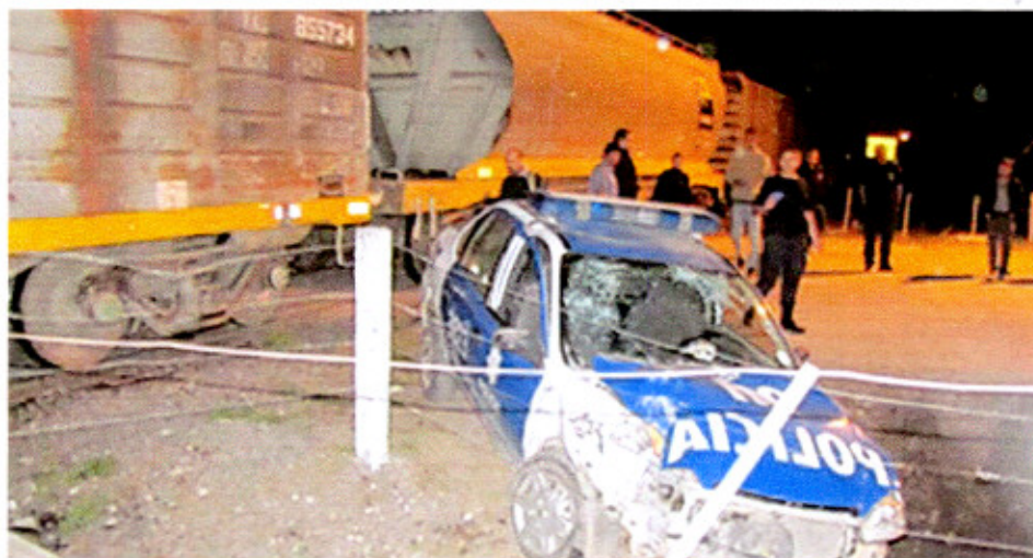
ACCIDENTE EN SAN LORENZO EN LAS VIAS DEL FC NCA